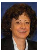
El Financiero Jacqueline Peschard

"Los candidatos a la Presidencia tienen una deuda moral con la sociedad mexicana y en particular con los jóvenes de este país, porque no han sido capaces de tener una visión más generosa y solidaria y de más largo plazo que les permita superar el estricto momento de lucha político-electoral. Tendrían que mostrar que todos están a favor del mismo objetivo de erradicar la violencia y la inseguridad, más allá de sus diferencias en cuanto a la forma y los énfasis para enfrentarlas, que sí es propio de cada plataforma electoral".