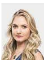
La Razón Ángeles Aguilar

"Hoy tenemos un enorme adeudo con la infancia. En el mundo hay 387 millones de niños en situación de pobreza extrema; es decir, que 19.5% de ellos sufre para hacerse de sus necesidades básicas; cifra muy por arriba de 9.2% de los adultos que viven en esas condiciones. En ese contexto, muchos abandonan la escuela por buscar un empleo. Datos de UNICEF revelan que hay 215 millones menores de 18 años que trabajan tiempo completo. A la mezcla sume a los miles de muchachos que son reclutados por grupos bélicos y por el crimen organizado".